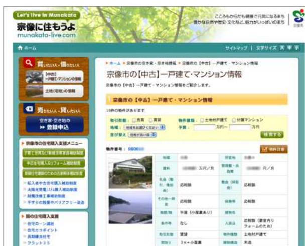
中古住宅(一戸建て・マンション)